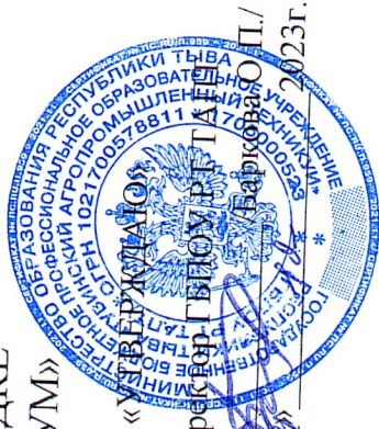
СХЕМА ОРГАНИЗАЦИИ ДВИЖЕНИЯ НА ЗАКРЫТОЙ ПЛОЩАДКЕ ГБПОУ РТ «ТУВИНСКИЙ АГРОПРОМЫШЛЕННЫЙ ТЕХНИКУМ»