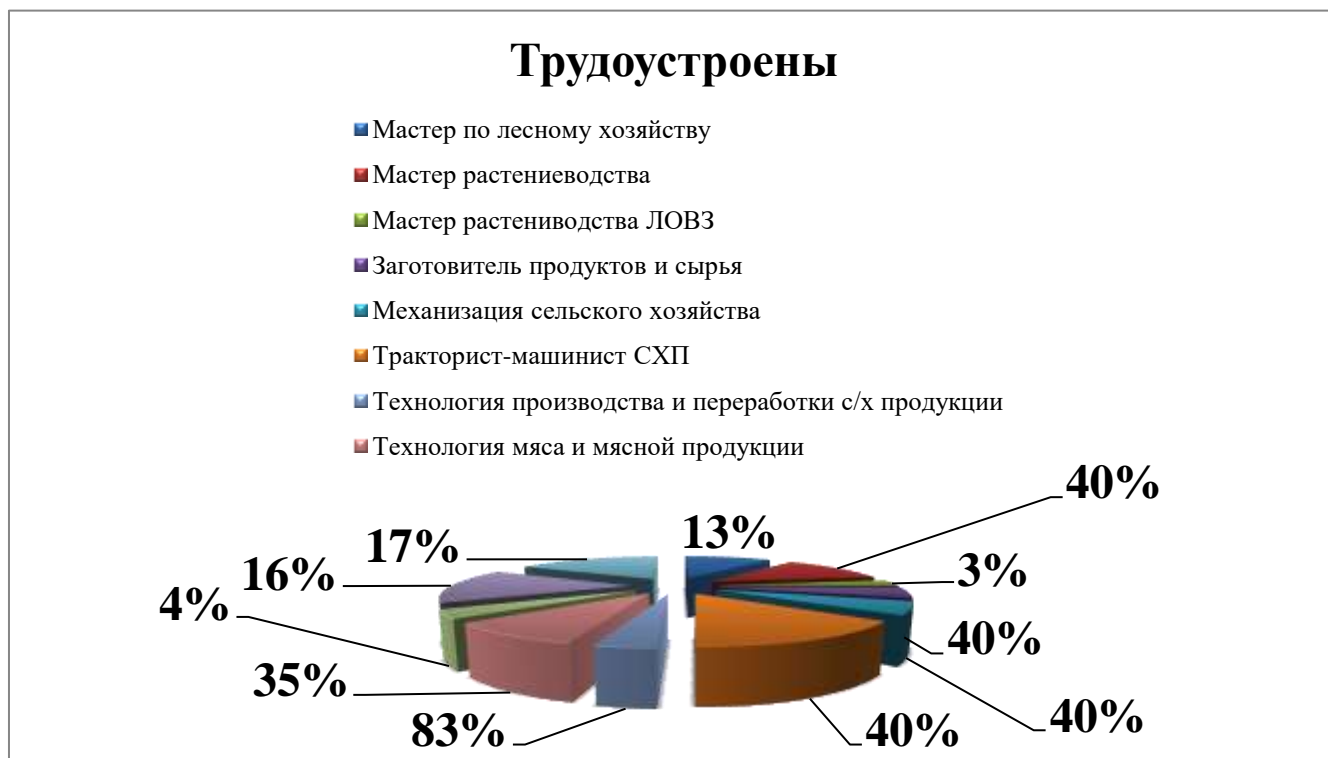
Рис. 1 Трудоустройство выпускников в 2023 году по группам

После получения диплома о среднем профессиональном образовании, многие выпускники направляются на работу как по своим специальностям, полученной в техникуме, так и на другие должности.